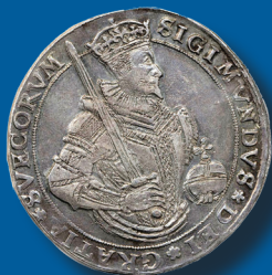
1 daler 1594 "SIGIMVNDVS" 677.000 kr

Objekt (inkl. köparprovision) som vi sålt tidigare: