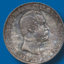
Norge 1 specie daler 1861 med B under bilden 2.238.000 kr

Bättre mynt och hela samlingar mottages fortlöpande.